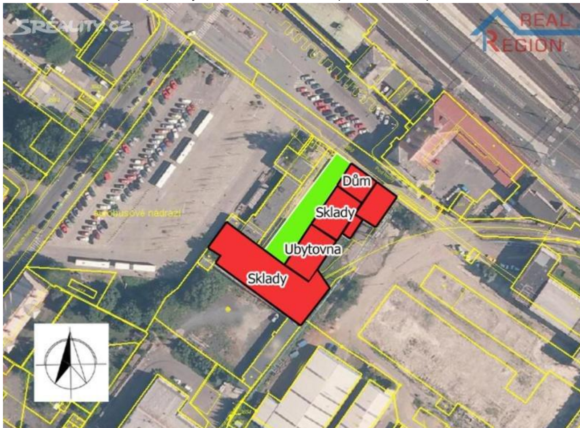
Obrázek 1: Dostupné prostory s možností umístění plánovaného podniku