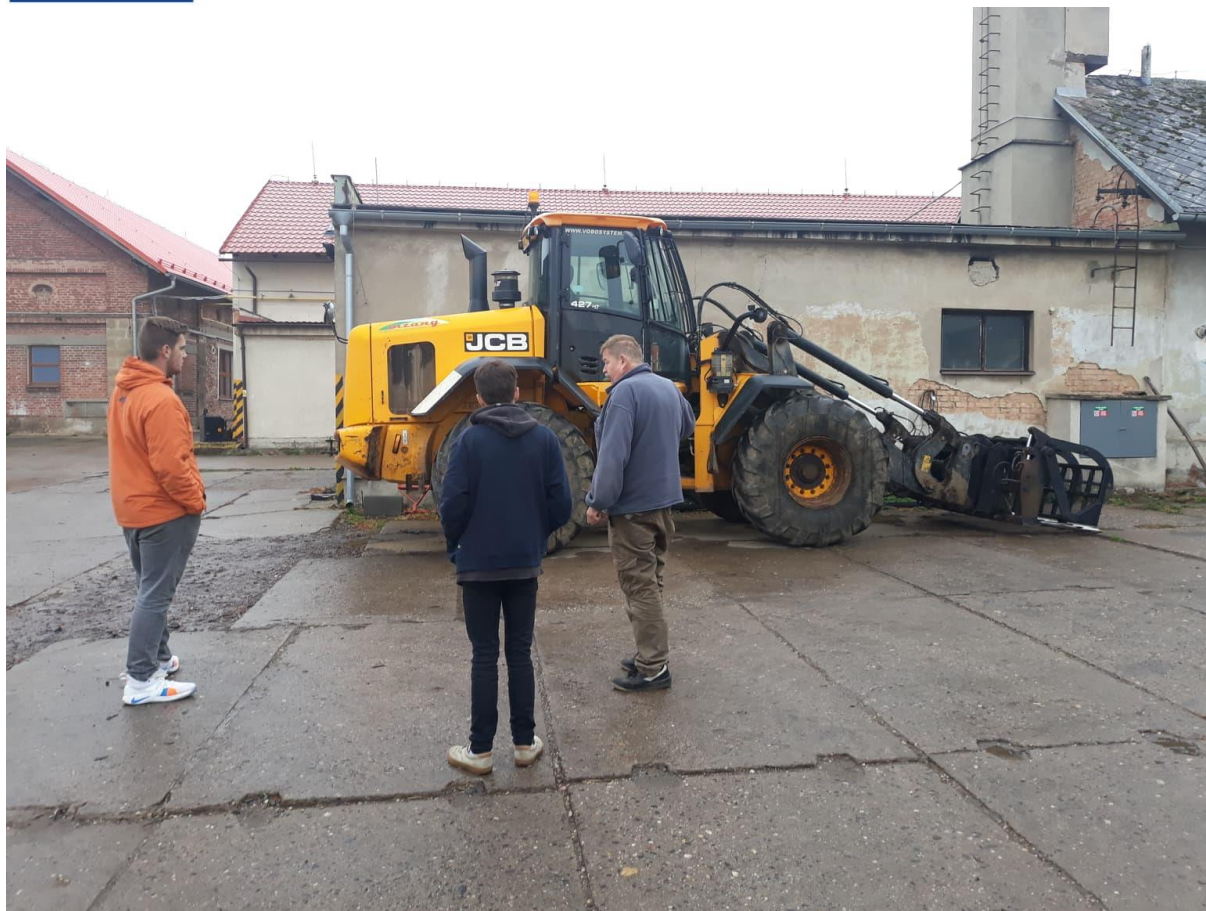
Foto: Návštěva zástupců cílové skupiny v ZAS Mžany a.s.

Další z klíčových aktivit v rámci projektu jsou vzdělávací a prožitkové pobyty zaměřené na rozvoj finanční gramotnosti a samostatnosti dětí . Za dobu realizace projektu jsou naplánovány dva vzdělávací čtrnáctidenní pobyty zaměřené na praktické finanční, vztahové, mezilidské a komunikační dovednosti. Součástí pobytů je i předání zkušeností v oblasti trhu práce, bydlení a sebepoznání. Plánovaná kapacita pobytů je 35 dětí a mladých lidí z dětského domova.