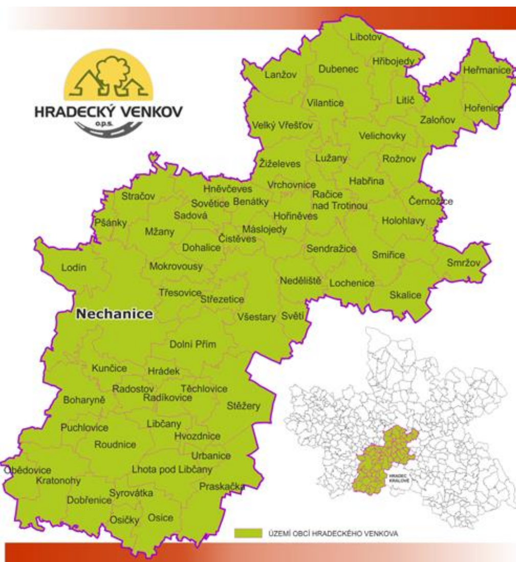
Obrázek: Mapa území MAS Hradecký venkov.

Hlavním cílem MAS je koordinace rozvoje regionu pomocí realizace projektů napříč různými oblastmi – multifunkční zemědělství, turismus, ochrana životního prostředí, vzdělávání, sociální služby, ekonomický rozvoj a podnikání. MAS zajišťuje také propagaci celého regionu a spolupracuje s orgány EU, státní správou a samosprávou na rozvoji regionu. Na současné programové období má MAS zpracovanou podrobnou Strategii komunitně vedeného místního rozvoje pro území Místní akční skupiny Hradecký venkov na období 2014 až 2020.