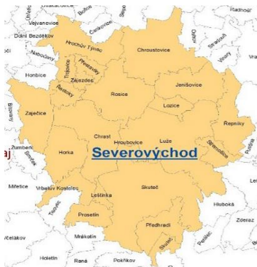
Mapa území MAS Skutečko, Košumbersko a Chrasteco, z.s..

Výsledkem těchto aktivit bylo celkové propojení několika různých témat, která měla přesah do stimulace místního rozvoje. Jednalo se za prvé o téma zemědělství a jeho propagace ve smyslu zdravého životního stylu a potenciálních léčebných účinků produktů z kozího mléka. Dále lze uvést nevyhovující podmínky lokálního trhu práce pro ženy samoživitelky, které nedávno ukončily rodičovskou dovolenou. Za další, získání dotace umožnilo rozvinout osobní entuziasmus realizátorky projektu ve vazbě na další aktivity místního rozvoje (přednášková činnost, rozšíření aktivit v oblasti ubytování apod.). V neposlední řadě sehrála MAS v těchto výsledcích klíčovou roli mediátora mezi realizátorkou projektu, odbornou poradkyní na projektový management a dohlížela na správné uchopení projektu tak, aby byly splněny podmínky vyhlášené výzvy.