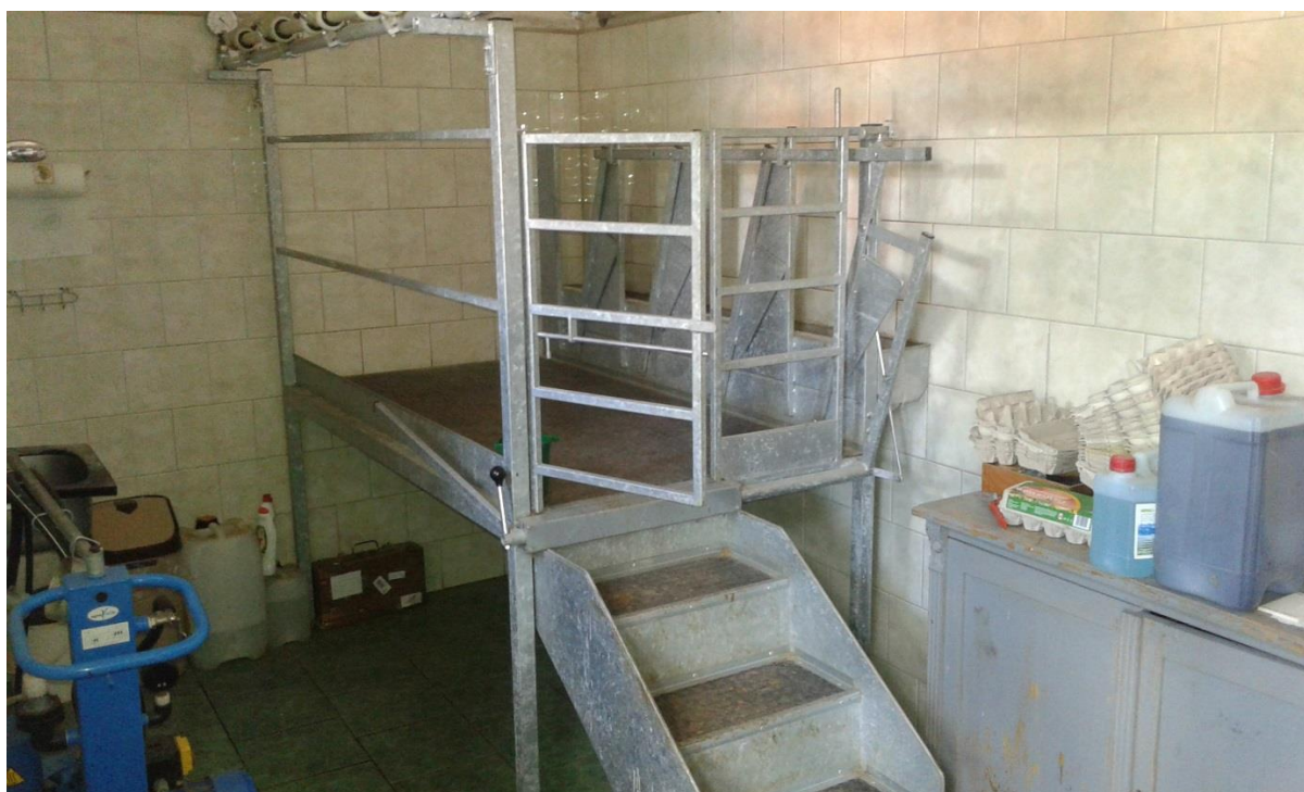
Foto: Místnost a zařízení pro dojení koz

„Spíš já jsem vždycky tíhla k tomu někomu pomáhat, pracovala jsem i v sociálním ústavu jako brigádník a na speciální škole a podobně. Pro mě to byla hlavně nová zkušenost a můj zájem o sociální zemědělství pořád trvá, takže je to první krůček k tomu, se téhle oblasti potom věnovat více.“ ... (realizátorka projektu)