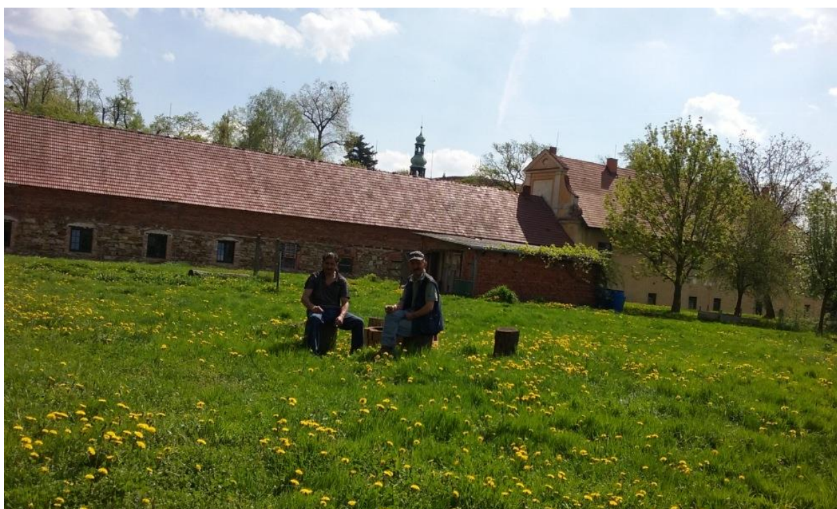
Foto: Komunitní zahrada v Doudleběch nad Orlicí

„Vždy se vytvořila dobrá podporující skupina lidí, není to jenom naše podpora jako realizátorů projektu a koučů, ale vzájemně mezi sebou se podporují. Bylo to vidět i při společném koučinku. ... Nebo vidí [účastníci programů z řad nezaměstnaných s malým nebo žádným zdravotním hendikepem], že jsou na tom třeba hůř, a že chtějí pracovat [účastníci s větším hendikepem či klienti spolupracujících organizací]. Nechtějí zůstat doma, chtějí dělat něco smysluplného, co ostatní ocení. Sice toho moc nedokážou, ale něco jo. Takže to je motivační i pro ty, co se jim nechce pracovat.“ (manažerka projektu)