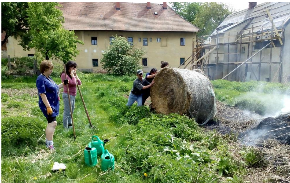
Foto: Komunitní zahrada v Doudlebských nad Orlicí

„Během těchto dvou měsíců dochází k aktivizaci lidí. Oni jsou často uzavřeni doma ve svém kruhu a nemají povinnosti vycházet ven, a díky projektu mají tu povinnost, a pak jsou schopni začít chodit do práce.” (manažerka projektu)