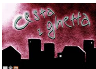
Obal hry Cesta z ghetta

„Neobvyklé je především prostředí, do něhož je hra zasazena - prostředí sociálního ghetta. Namísto zámků v ní najdeme polorozbořené domy, místo rytířů se hráči stávají chudými, dlouhodobě nezaměstnanými lidmi - bez prostředků a s mizivou životní perspektivou.“