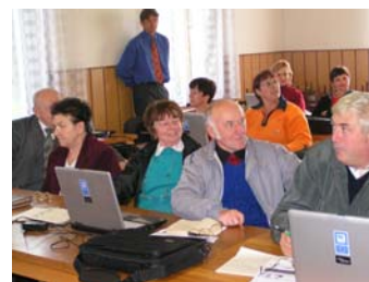
Počítačová výuka v obci Bělá

Reakce jsou od mírně pozitivních až po naprostou fascinaci projektem. Všichni (účastníci i nezávislí pozorovatelé) považují tento typ vzdělávání za velmi potřebný a žádoucí. Někdy se trochu pozastavují nad výběrem „předmětů“ ve vzdělávací nabídce, je to však dáno počátečním průzkumem v obcích a možnostmi partnerů – vzdělávacích středisek. Negativní jsou většinou jen ohlasy těch obcí, které nebyly zařazeny do vybraných, a to spíš jen s otázkou proč oni zrovna ne.