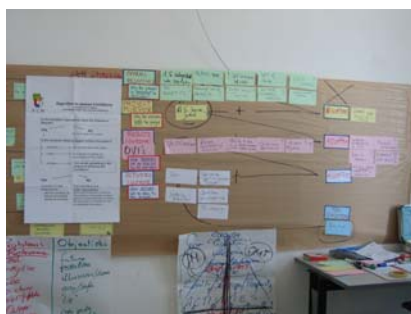
Metoda řízení projektového cyklu

V návaznosti na konferenci ve Varšavě proběhlo prakticky zaměřené školení ve dnech 11. – 12. 6. 2007 v Cagliari na Sardinii, jehož obsahem byla ta část metody řízení projektového cyklu, která je zaměřena na hodnocení žádostí o finanční podporu. Účast na semináři o PCM byla přínosem zejména možností praktického cvičení a vyzkoušení, jak metoda funguje v praxi ve skupinách se zástupci řídicích orgánů z 27 členských zemí. V závěru školení byl představen spolupracující přístup členských států na aplikaci PCM a naznačeny možnosti, které PCM umožňují uplatnit při téměř všech činnostech implementace programu. Metoda PCM důsledně dbá na porovnání vstupů a výstupů, cílů a prostředků k jejich dosažení v projektových žádostech budoucích příjemců pomoci. Hodnotitel žádosti by měl pečlivě zvážit, zda prostřednictvím realizace navržených aktivit skutečně dojde ke splnění stanovených cílů. V mnoha praktických případech se ukázalo, že ne vždy je možné dosáhnout očekávaného cíle i přesto, že naplánované aktivity s pomocí pro cílovou skupinu souvisí.