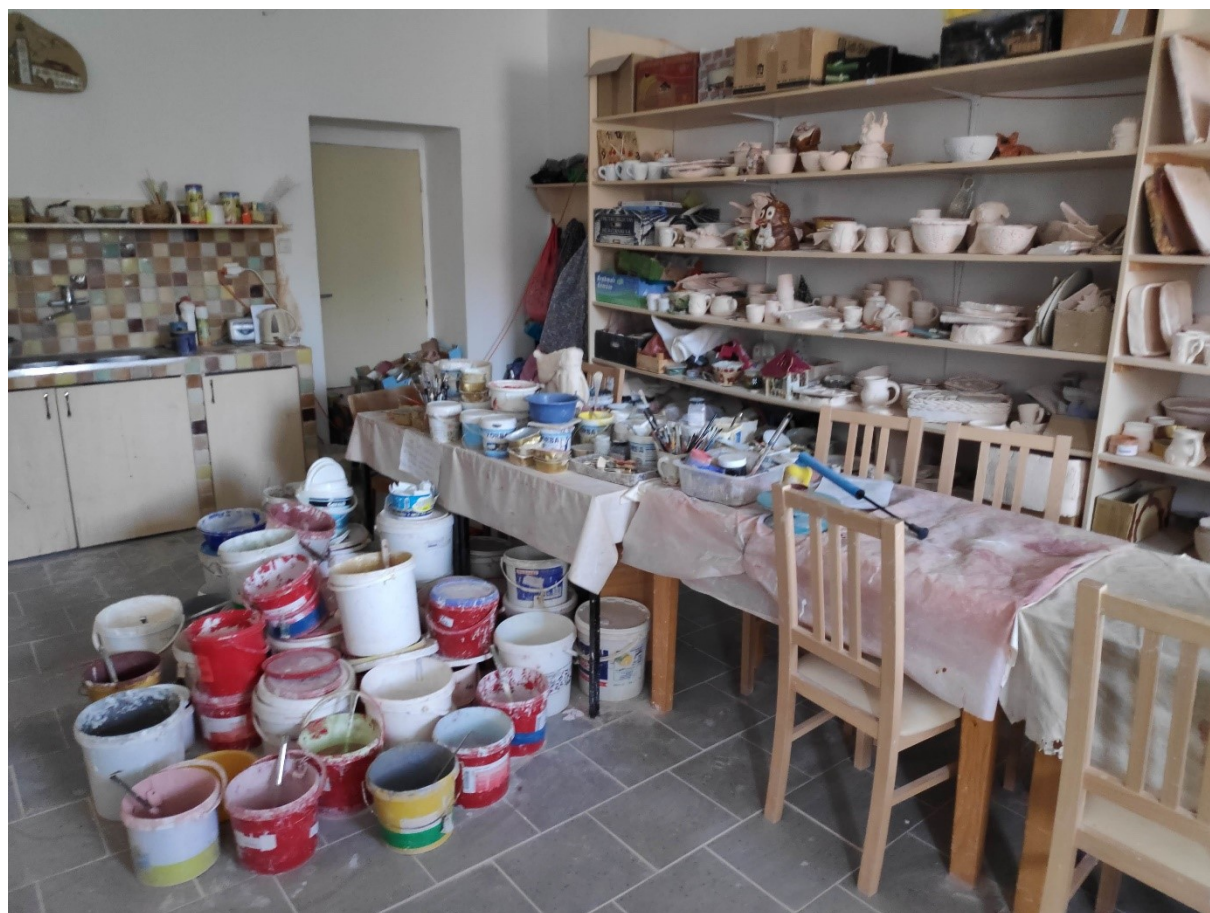
Obr. 2 Keramická dílna

Myšlenka celého projektu komunitního centra se vytvářela dlouhodobě na základě různých impulzů, které postupně vykrystalizovaly do myšlenky vytvoření komunitního centra. Prvním impulzem bylo převzetí a provozování keramické dílny, která původně vznikla v prostorách místního kláštera. Dalším potom vytvoření dětské skupiny pro děti, které nemohly být z kapacitních důvodů přijaty do mateřské školy. Třetím impulzem pro vytvoření komunitního centra byla skutečnost, že místní knihovna se začala rozrůstat a potřebovala větší prostory a zázemí. Tyto hlavní tři impulzy spolu s některými dalšími, jako například nedostatek vhodných prostor pro poradny sociálních služeb ve městě, vyústily v myšlenku soustředit všechny tyto aktivity do jednoho objektu. Tento objekt byl vybrán a následně zrekonstruován. Důležitým faktorem při rekonstrukci objektu bylo to, že již od počátku vedení města Nové Hradky vědělo, co by mělo komunitní centrum zahrnovat. Investiční projekt výstavby komunitního centra byl od začátku navržen tak, aby obsahoval prostory knihovny a čítárny, komunitní kuchyňku, hernu pro děti, keramickou dílnu, učebnu a prostory pro poradenské služby. Jedinou součástí, která nebyla dlouhodobě plánována a vznikla až při výstavbě komunitního centra, je komunitní dílna.