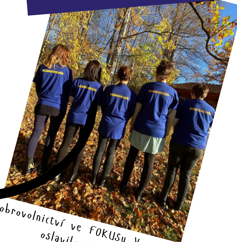
Dobrovolnictví ve FOKUSu Vysočina oslavilo 25 let.

skupina závislosti čchi kung jóga tvořivé činnosti masáže úklid doučování "záskoky"