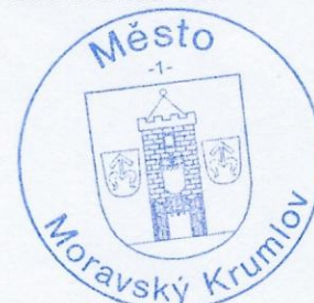
Mgr. Tomáš Třetina starosta města