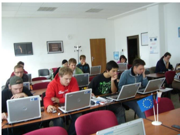
Zaměstnavatelé u nových zaměstnanců velmi oceňovali obecně využitelné dovednosti, jakými jsou například kurz práce na PC, účastnictví, základy podnikání, apod.