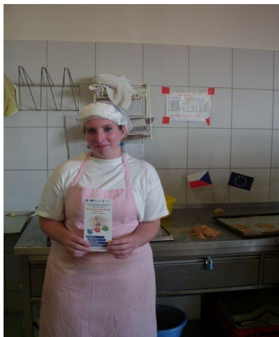
Absolventka rekvalifikačního kurzu