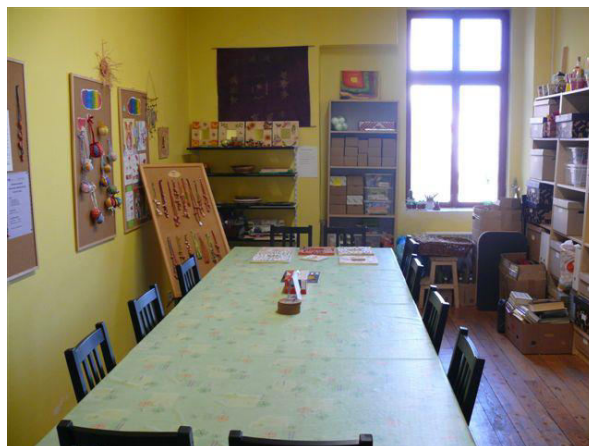
Obr. 2 Ruční dílny jsou součástí aktivizačních služeb

"Při dílnách, kde něco tvoříme, se musím soustředit jenom na tu práci. Nemusím přemýšlet o své nemoci. Přijdu na jiné myšlenky."