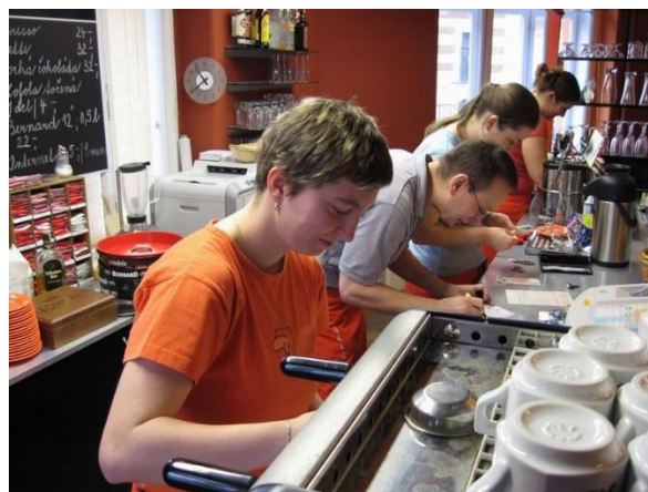
Obr. 1 Fokus kafe - Ústí nad Labem zdroj: www.fokuslabe.cz

Dále podporují soběstačnost klienta s cílem zajistit jeho dlouhodobou udržitelnost v zaměstnání.