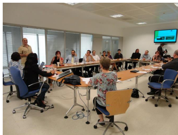
Realizace společných setkání a workshopů napomáhala přenosu dobrých praxí a sdílení zkušeností mezi aktéry.

Podařilo se tak nastavit spolupráci nejen s pracovníky dalších MČ Prahy řešící obdobné problémy, ale i propojit odbory MČ Prahy 14 (investiční, bytový, sociální) ke společnému komplexnímu řešení.