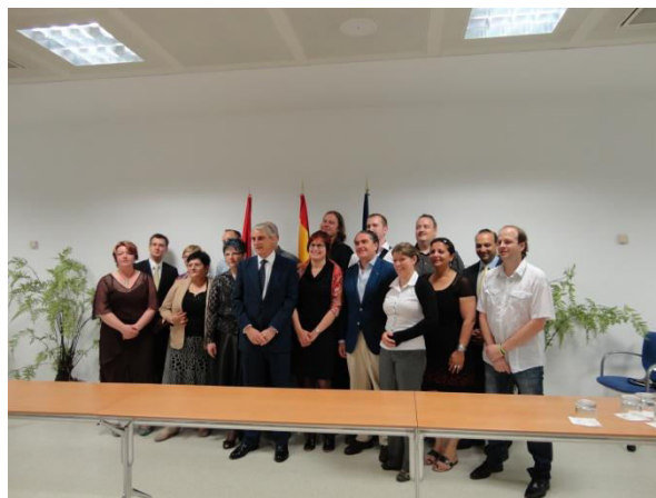
V rámci projektových aktivit byly realizovány stáže za účasti široké skupiny relevantních aktérů (oborově i regionálně)

Získané poznatky i jejich aplikace na území MČ Praha 14 byly následně šířeny do dalších MČ na území hl. m. Prahy, které se chtějí zabývat (respektive se již zabývají) integrací Romů či obyvatel sociálně vyloučených lokalit.