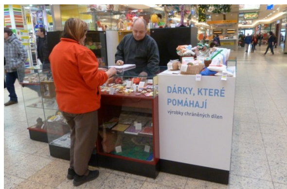
Stánek Sdružení Práh s výrobky chráněných dílen z celé České republiky v galerii Vaňkovka v Brně vznikl v rámci projektu jako nové pracoviště, kde bylo zaměstnáno 6 osob na pozici prodavače. Obchůdek zůstává v provozu i po skončení projektu.

Celkem 37 osob získalo v průběhu projektu zaměstnání na nově vytvořených pracovních místech, z toho 13 ve Sdružení Práh a 24 u běžných zaměstnavatelů.