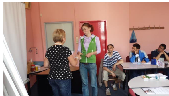
Některé z podpořených osob začaly po skončení projektu využívat služeb občanského sdružení Světlo Kadaň, čímž byla u těchto osob zajištěna udržitelnost získaných poznatků a dovedností a jejich další rozvoj.

U osob vracející se z výkonu trestu a osob po ústavní léčbě ze závislosti na návykových látkách, bylo třeba vzhledem k jejich nízkému sebehodnocení především zvýšit jejich sebevědomí a naučit je vnímat a umět ohodnotit své pozitivní stránky. U některých se nakonec podařilo dosáhnout částečných změn v sebepojetí, kdy dokázali sami říct, v čem jsou dobří a co by mohli zaměstnavatelům nabídnout. Někteří měli dokonce nulovou zkušenost z trhu práce, jeden z nich dokonce poprvé pracoval s počítačem. U osob po výkonu trestu byla však jejich motivace k resocializaci a integraci na trh práce často snižována nedořešenými záležitostmi z minulosti, například vysokou pravděpodobností jejich dalšího odsouzení za činy spáchané již před lety. Z této cílové skupiny nedošlo po skončení projektu k návratu na trh práce u žádného z účastníků. Naopak dva nebo tři účastníci se vrátili zpět do výkonu trestu.