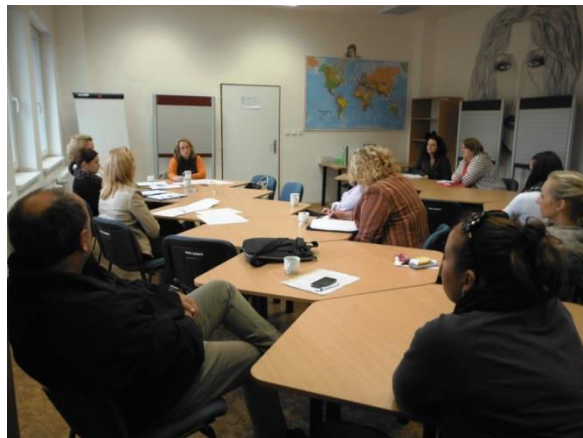
1 Klientská případová konference