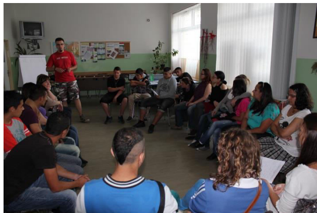
2 Nízkoprahové centrum pro děti a mládež ve Stovkách