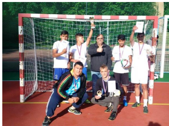
Pouliční liga 2015.