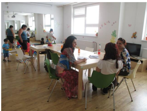
SAS SC Kamínek.