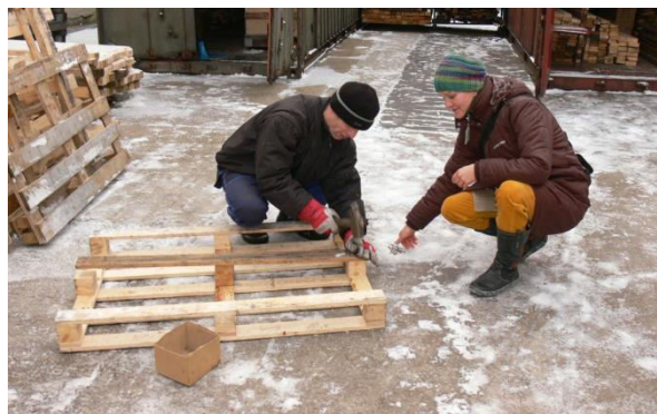
Na otevřeném trhu práce byli účastníci zaměstnáni na pozici třídíče odpadu, pomocného dělníka či uklízečky. Udržení zaměstnání výrazně napomohla pracovní asistence.

Hlavní motivací k nalezení zaměstnání pro většinu osob z cílové skupiny bylo zvýšení finančního příjmu. Vlastní příjem pomáhá ke snížení finanční závislosti na rodině i na invalidním důchodu.