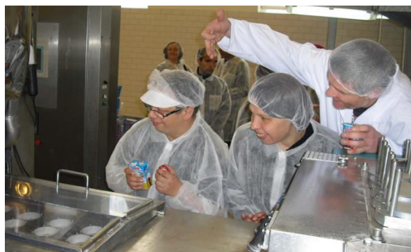
V rámci exkurzí do firem se osoby z cílové skupiny mohly seznámit s realitou pracovního prostředí a prohloubily si povědomí o konkrétním druhu zaměstnání.