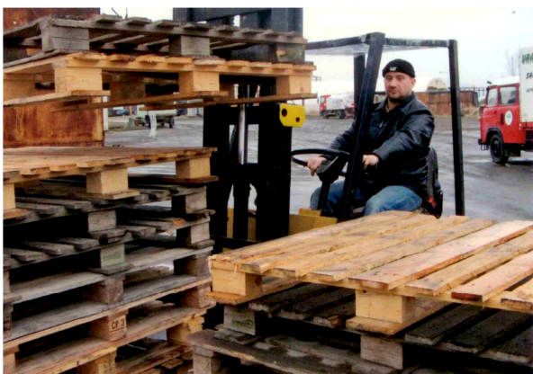
Jednou z hlavních aktivit projektu zaměřených na zvýšení kvalifikace účastníků projektu byl kurz obsluhy vysokozdvížného vozíku