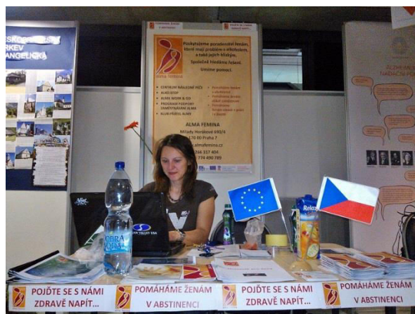
Propagace projektu na veletrhu NNO