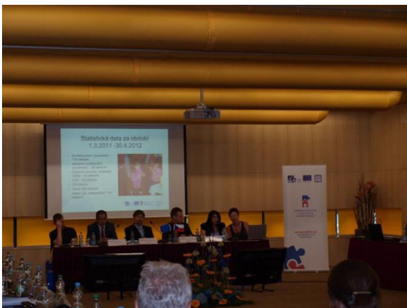
1 Prezentace projektu na zasedání Monitorovacího výboru OP LZZ

Co se zaměstnanosti týče, je veškerá snaha limitována ekonomickou situací regionu. Počet klientů, u kterých tak vznikl pracovní poměr, činil 21 osob.