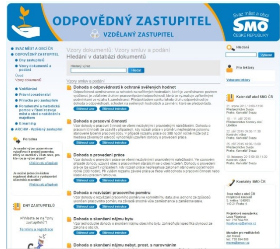
Webová platforma se vzory dokumentů a podání

o zrušení trvalého pobytu, vzor odmítnutí poskytnutí informace či sazebníku podle zákona o svobodném přístupu k informacím, vzor pracovní smlouvy, vzor výpovědi, vzor pro vymáhání pohledávek obce, vzor majetkového přiznání, vzor jednoduché zadávací dokumentace a úkonů zadavatele, vzory úkonů ve stavebním řízení, vzory obecně závazných vyhlášek a nařízení obce, atd.