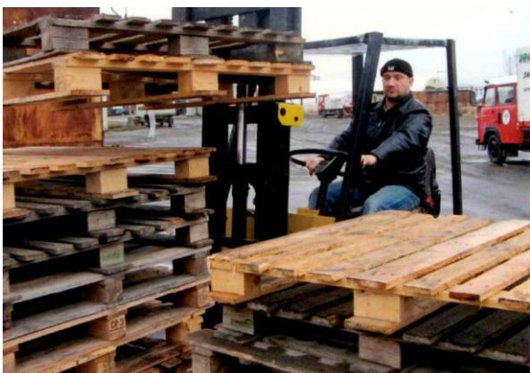
Jednou z hlavních aktivit projektu zaměřených na zvýšení kvalifikace účastníků projektu byl kurz obsluhy vysokozdvizného vozíku